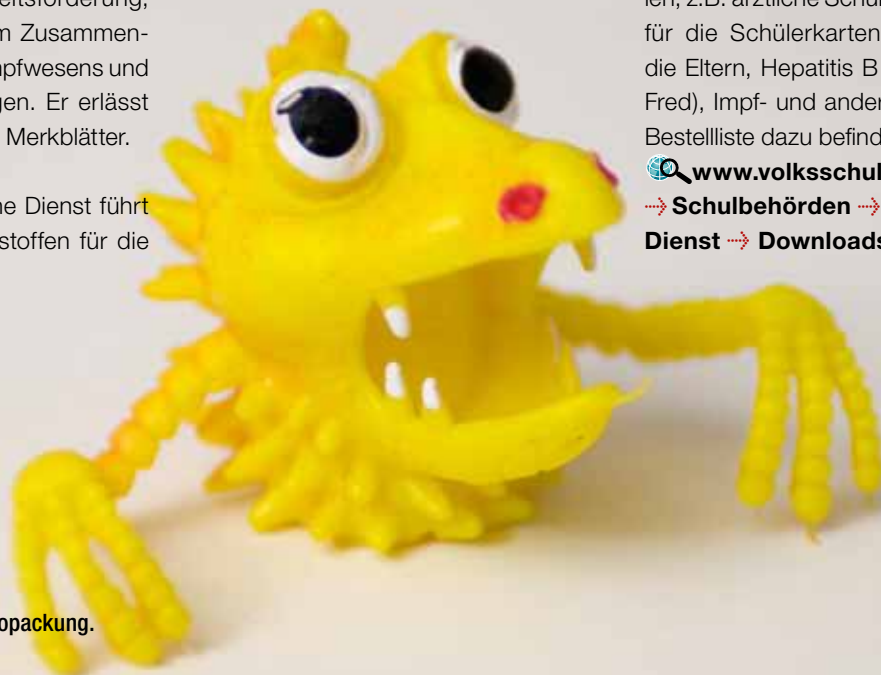
«Fred» aus der Hepatitis-B-Infopackung.

→ Schulbehörden → schulärztlicher Dienst → Downloads